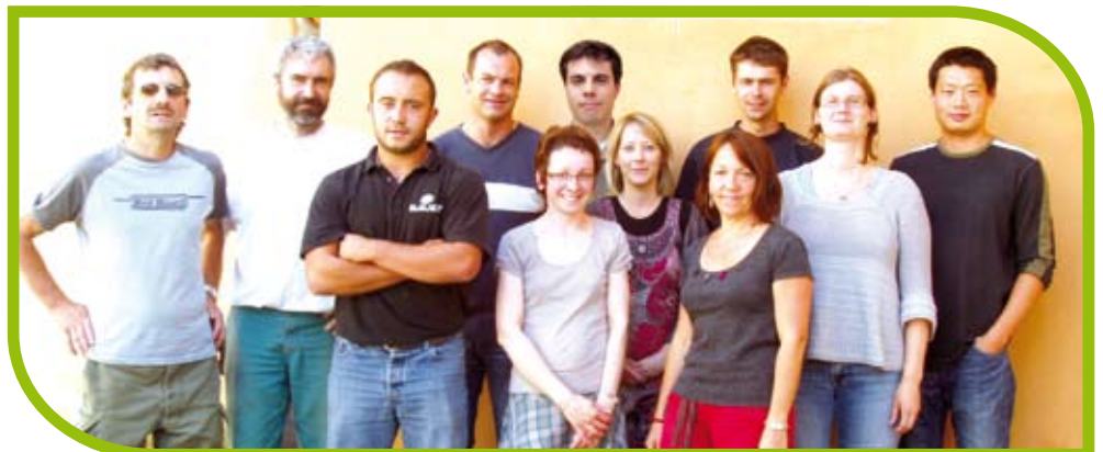
L'équipe du SMABB au complet.