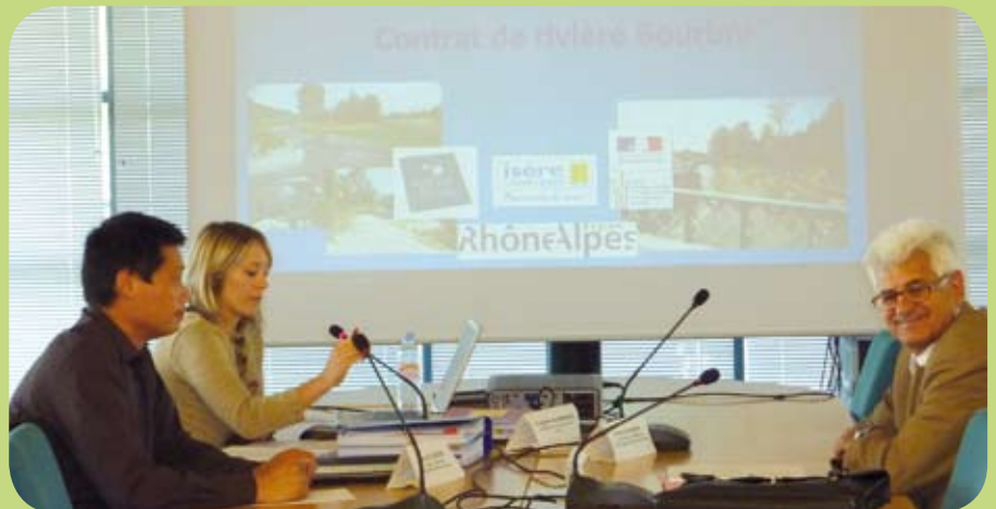
Présentation devant le comité d'agrément

Les opérations inscrites dans ce contrat bénéficient d'un soutien financier spécifique de la Région Rhône-Alpes, du Conseil général de l'Isère, de l'Agence de l'eau et de l'État.